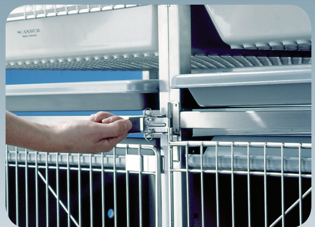
Einfaches Verkoppeln von Gestellen