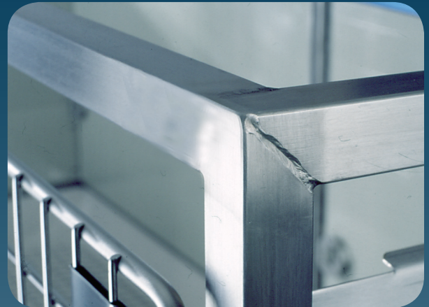
Vollgeschweisste und geschliffene Rohrkonstruktion