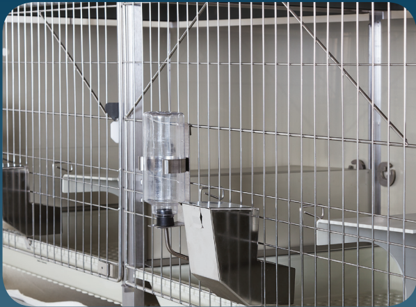
Grosse zusammenhängende Liegefläche